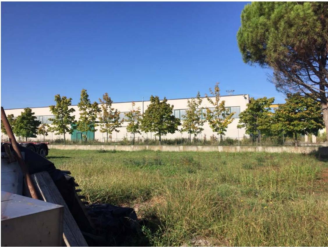
PUNTO DI VISTA N. 4