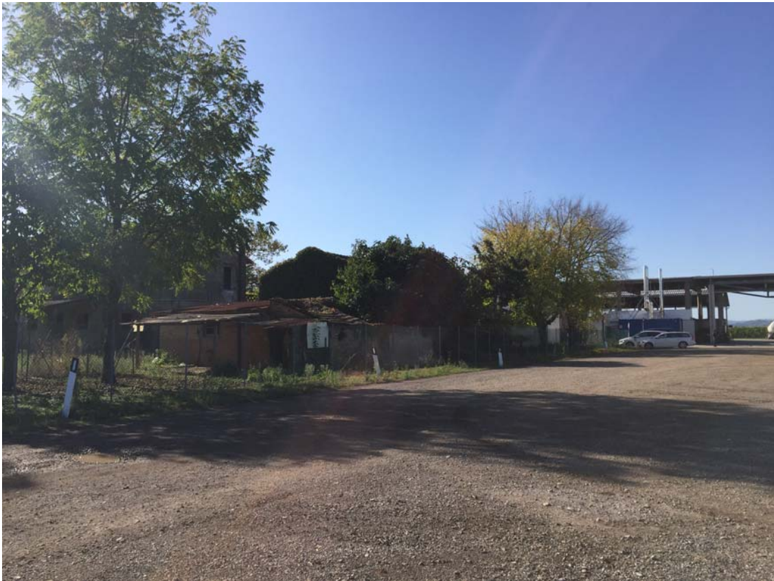
PUNTO DI VISTA N. 1