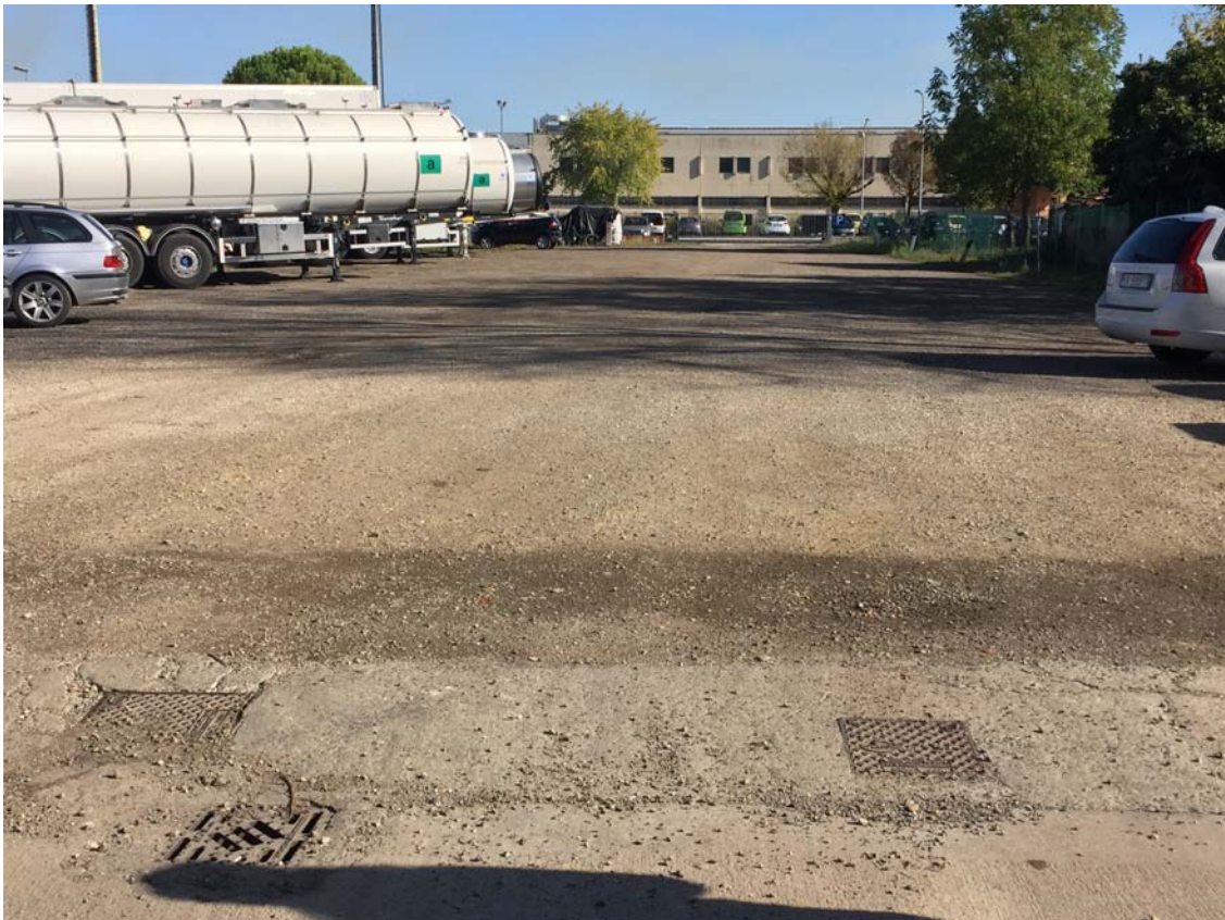
PUNTO DI VISTA N. 2