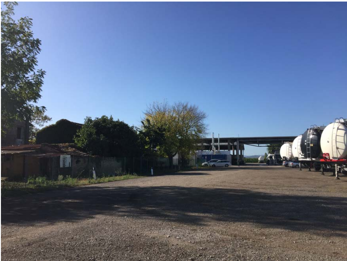
PUNTO DI VISTA N. 3